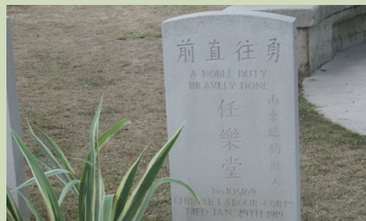
▲ 一位山東戰士的墓碑上刻著「勇往直前」