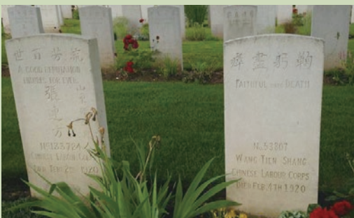
▲ 墓碑上刻著工整的漢語「流芳百世」「鞠躬盡瘁」等